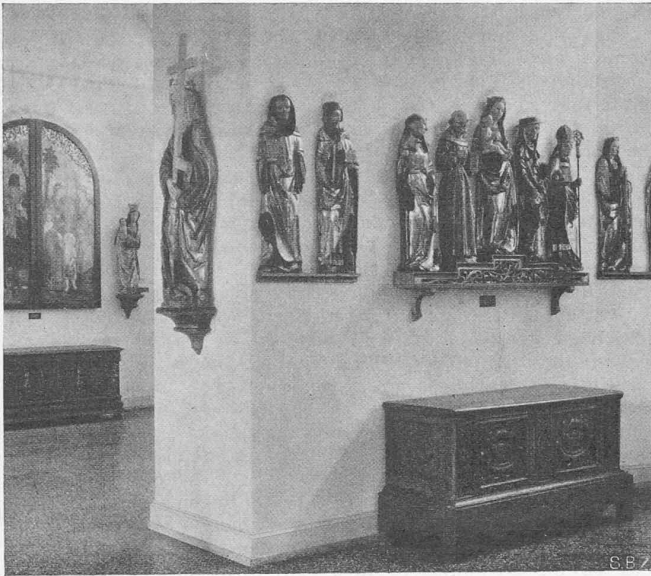
Abb. 4. Aus Saal 2b: Bemalte hölzerne Altarfiguren, Locarno, um 1500.