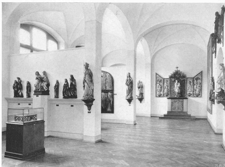
KIRCHLICHE KUNST DES 15. JAHRHUNDERTS IM SAAL 1c SYSTEMATISCHE AUFSTELLUNG MITTELALTERLICHER KIRCHLICHER KUNSTWERKE IM SCHWEIZER. LANDESMUSEUM IN ZÜRICH