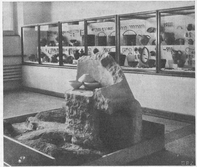
Abb. 7. Saal 78: Töpferofen aus Sissach, 1. Jahrh. v. Chr. (ergänzt). Gräberfunde aus Arbedo-Molinazzo, 6. bis 2. Jahrhundert v. Chr.