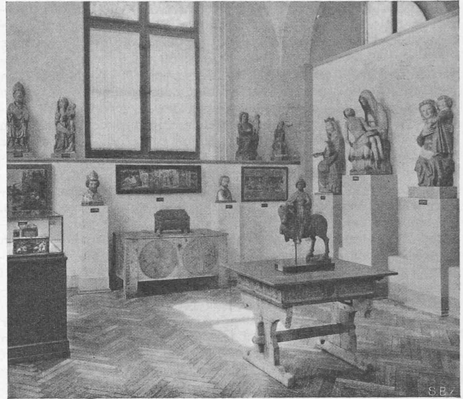
Abb. 5. Ecksaal 1b, Erdgeschoss. Bildwerke des 13. u. 14. Jahrhunderts.