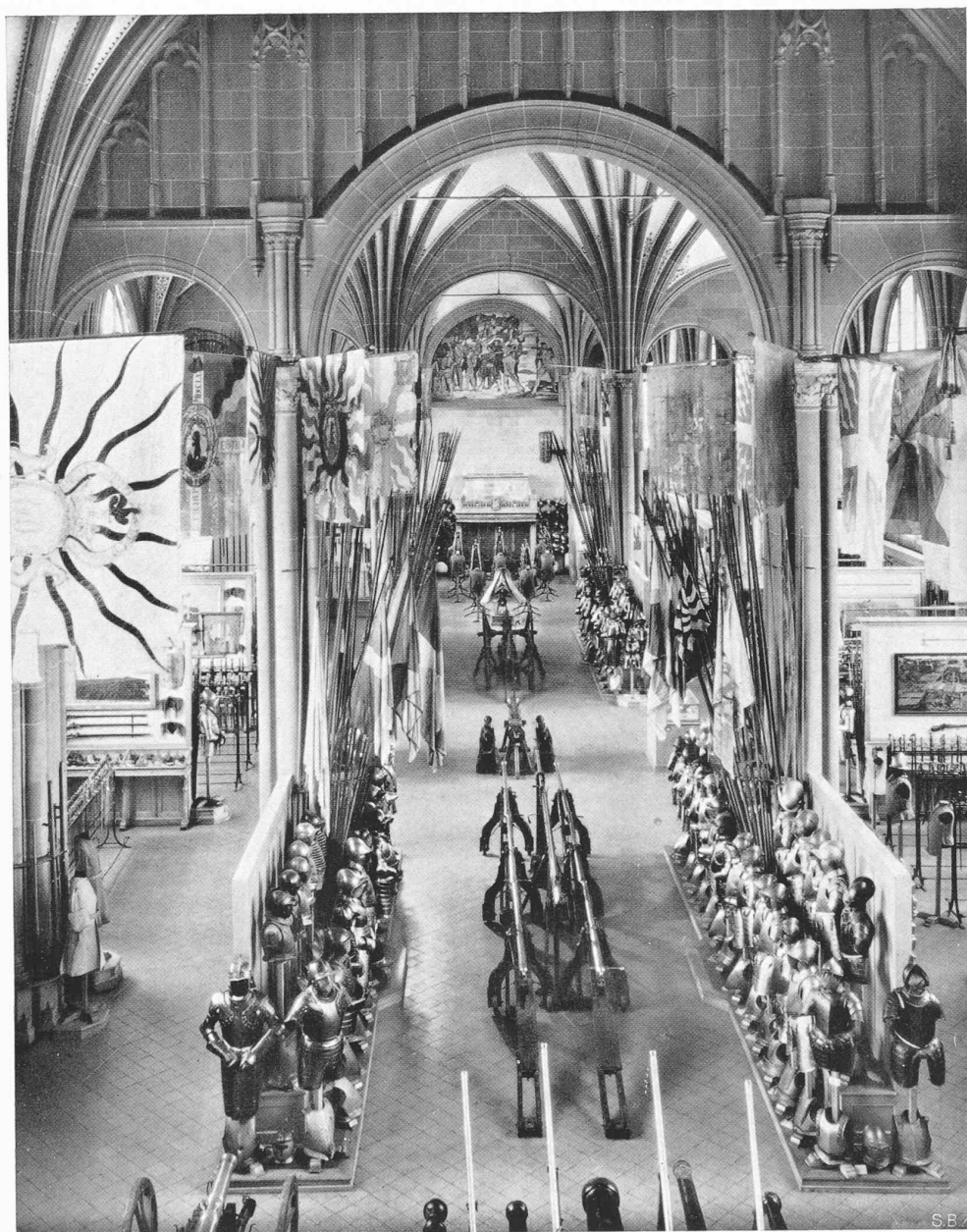
DAS SCHWEIZERISCHE LANDESMUSEUM IN ZÜRICH FREIELEGTER DURCHBLICK DURCH DIE GROSSE WAFFENHALLE MIT DEN MARIGNANO-FRESKEN VON FERD. HODLER