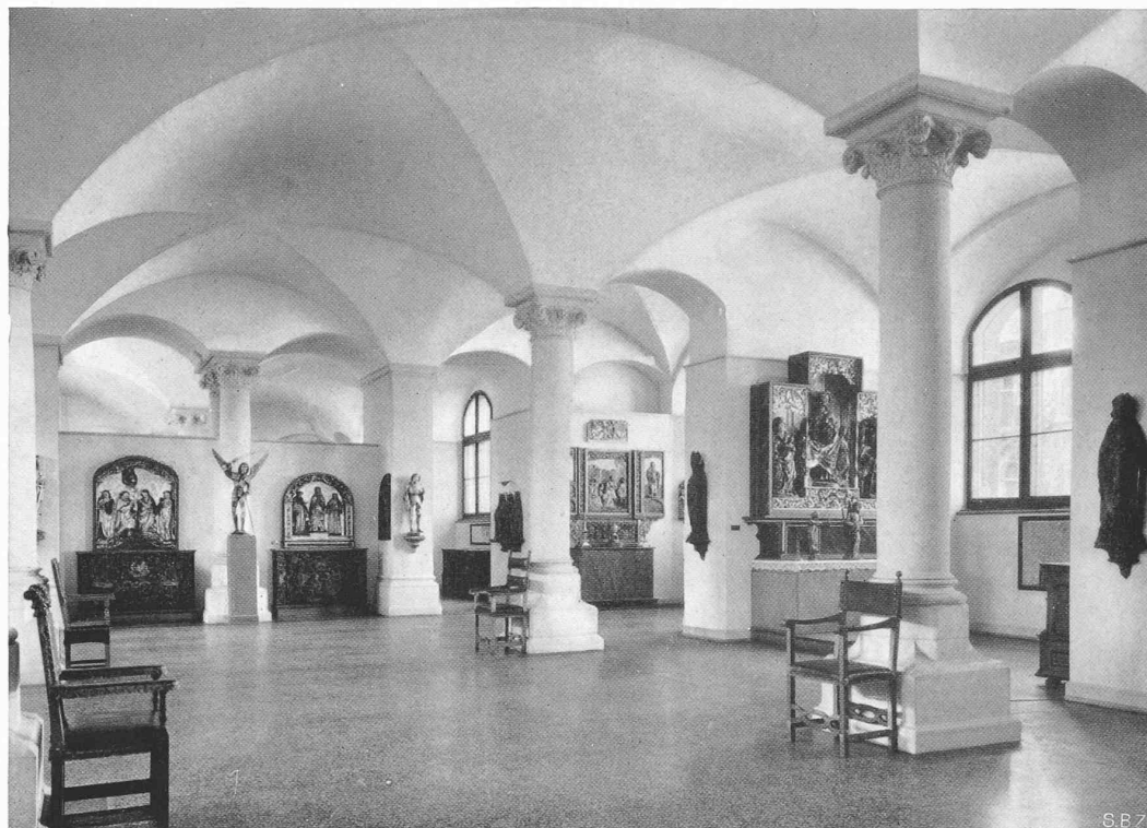
KIRCHLICHE KUNST DES 16. JAHRHUNDERTS IM MITTELSAAL 2b DES ERDGESCHOSSES Altäre aus Seewis (Ilanz), Kazis, Schloss Wartensee und Naters (Wallis)