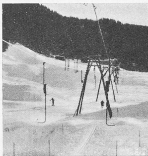
Abb. 1. Tiefhängende Schleppbügel an der untern Station.