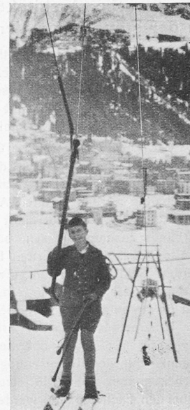
Abb. 4. Ankunft oben.