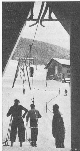
Abb. 3. Abfahrt an unterer Station.