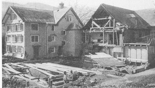
Abb. 1. Anfangsstadium der Hausverschiebung, aus Nordosten.

Zur Bedingtheit der Leistung von Atemfiltern durch die Art der Benützung ist folgendes festzustellen: Die Luft durchströmt den Filter nicht kontinuierlich, sondern im Atmungsrythmus. Bei der ventilgesteuerten Atmung durchströmt die Luft den Filter nur in einer Richtung. Bei der Verwendung von Atemfiltern ohne Ausatemventil durchströmen sowohl Ein- als auch Ausatemluft