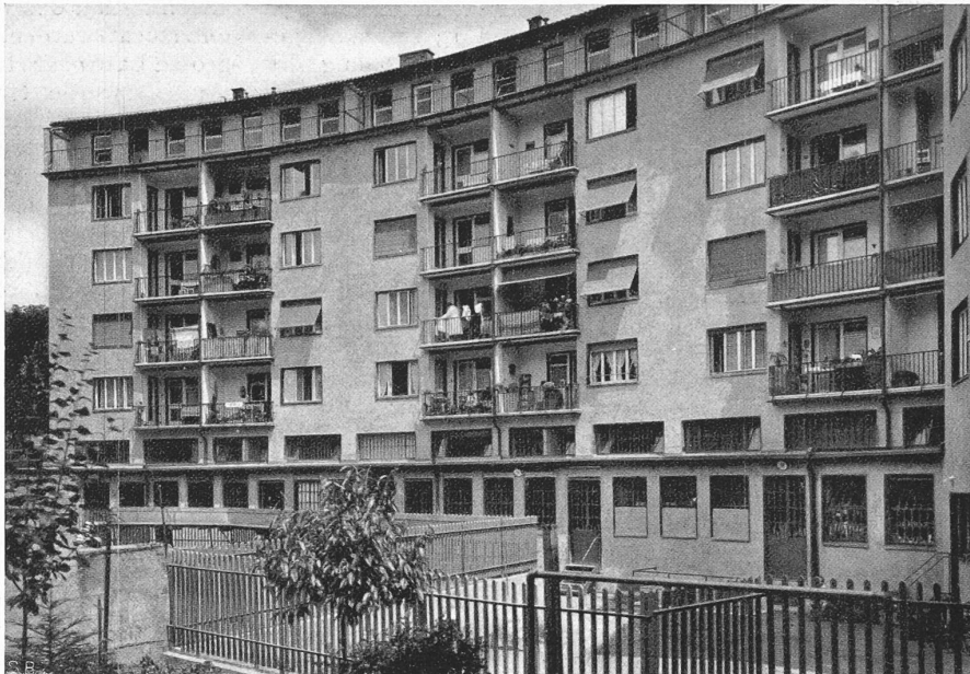
Abb. 3. Hofseite des Hauptflügels. Die breiten Fenster belichten die innern Lagerräume (Schnitt C-D).

Erdgeschosspfeiler und alle Stockwerk-Decken wurden in armiertem