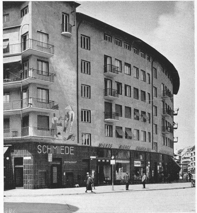
Abb. 4. Läden und Wohnungen im Hauptflügel an der Birmensdorferstrasse.

Der besonders am Stahlbau interessierte Leser findet in den Aufsätzen von Schächterle, Gaber, Schulz-Buchholtz, v. Kazinczy, Bryla und Young einlässliche Darlegungen über den neuesten Stand der Ermüdungsfrage, der Festigkeitsprüfung von Niet- und Schweissverbindungen, in reiner oder gemischter Ausführung, sowie über die Knickfrage. Der im Erwerbsleben tätige Ingenieur wird für diese Arbeiten recht dankbar sein, vermitteln sie ihm doch auf relativ knappem Raum einen willkommenen Ueberblick über die Ergebnisse der sehr umfangreichen Versuchsarbeiten in den Materialprüfungsanstalten. Die Dauerfestigkeit des Stahles und seiner Verbindungen steht dabei im Vordergrund, und die Versuchsergebnisse verdienen ernsteste Beachtung, wenn damit auch ein allzu lebhaftes Vorwärts-