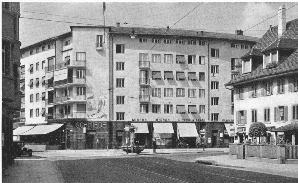
Abb. 2. Der Baublock „Schmiede Wiedikon“ in Zürich. — Arch. Moser & Kopp, Zürich.

grund geschlagen wurden. Nach dem Ausspülen des eingefangenen Sandes rammt man im Innern der Rohre T-Profile noch tiefer und betonierte zuletzt die Rohre aus. — Um die häufigen Ueberschwemmungen von New Orleans zu verhindern, wird dem Mississippi 35 km linksufrig oberhalb der Stadt ein seitlicher Abfluss in den grossen Lake Pontchartrain geöffnet. Dieser rd. 3 km breite Entlastungskanal, der Bonnet Carré Spillway, wird von drei Eisenbahnen und einer Hauptverkehrsstrasse gekreuzt, sodass im Ganzen etwa 12 lfd. km Brücken notwendig werden. Sie sind alle nach dem Gerüstbrückentypus in verschiedenen Baustoffen ausgeführt, auch hölzerne sind dabei, deren Böcke hie und da durch Betonwände ersetzt sind, um der Ausbreitung allfälliger Brände einen Riegel zu schieben. Für die Foundation in dem grundlosen Alluvialboden kamen nur Reibungspfähle in Betracht. Die Strassenbrücke aus armiertem Beton ruht auf Eisenbetonpfählen von 61 \times 61 cm Querschnitt und bis 27,5 m Länge. Verladen werden die Pfähle durch einen Portalcran mit Lasttraverse, die den Pfahl an drei Punkten fasst, während er von der Ramme nach der bei diesen Dimensionen üblichen