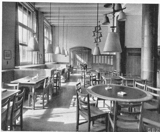
Abb. 6. Wirtschaft, vom Eingang her gesehen.

Die Spezialisten dieses Faches werden ihre Freude haben an den ersten Heften des Jahrgangs 1935 von „Eng. News Record“, die eine ganze Reihe verschiedener grosszügiger Bauten und Installationen zeigen. — Ein Landungsteg in Davenport bei Sta. Cruz an der kalifornischen Ozeanküste, der nur die unbedeutende Belastung von Oel-, Wasser- und Zement-Transportleitungen, aber stärksten Wellenangriff zu ertragen hat, ist ganz aus Eisenkonstruktion, unter mühsamem Kampf gegen Wind und Seegang geschweisst worden. Als Pfähle dienten Rohre, die durch eine Sandschicht in den Schiefer-