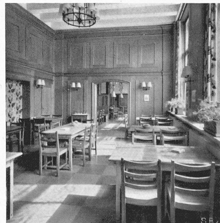
Abb. 7. Saal, Durchblick gegen Restaurant.