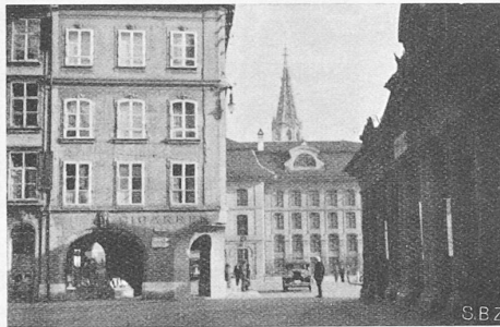
Abb. 2. Blick aus der Amthausgasse gegen den Engpass, rechts die Hauptwache, hinten der Kasinoplatz.