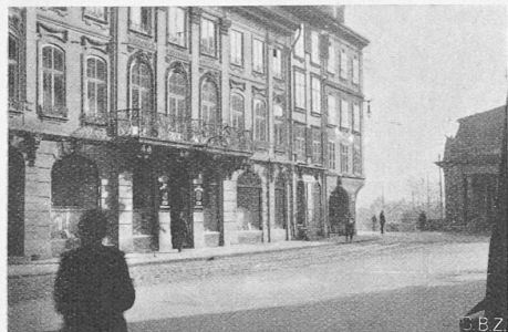
Abb. 1. Blick aus NW auf den Engpass zwischen den südlichen „Du Théâtre“-Anbauten und der Hauptwache.