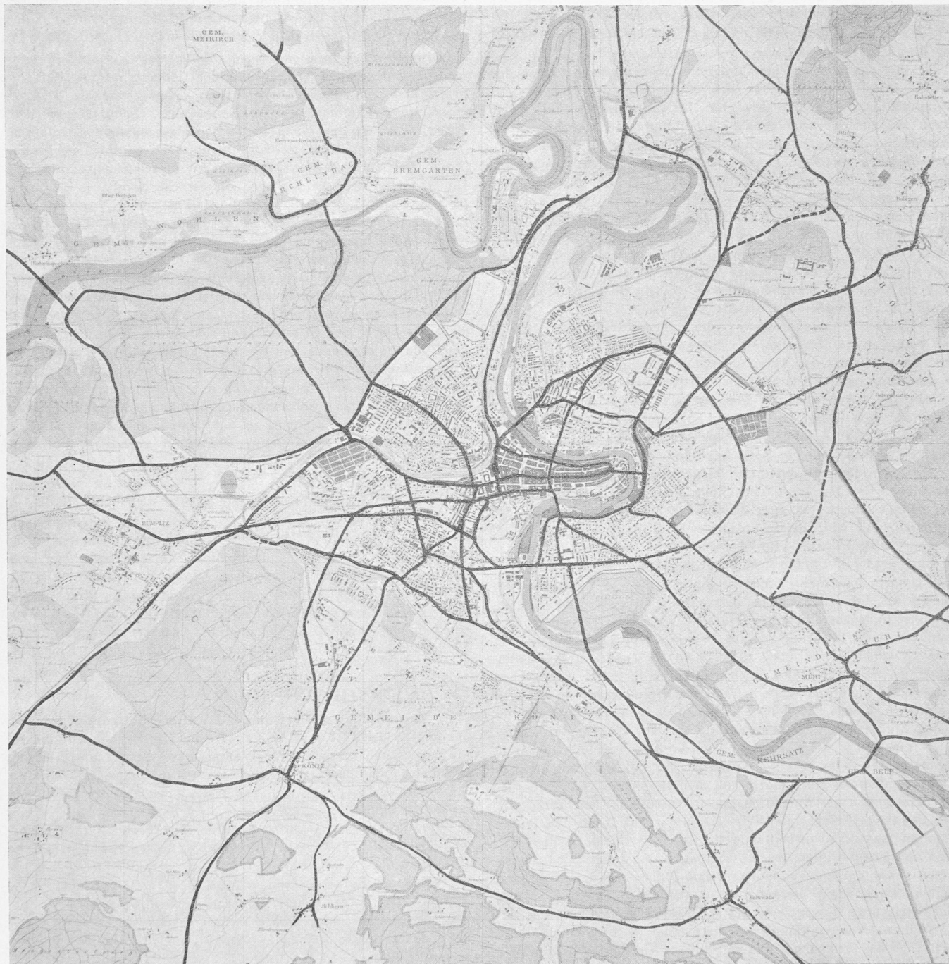
WETTBEWERB GROSS-BERN: Das Strassennetz, wie es vom Preisgericht als wünschenswert erachtet wird, mit den Ausfall- (Radial), Umgehungs- und Ringstrassen und den drei neuen Aarebrücken (Gaswerk-, Eichholz- und Flugplatzbrücke) im Süden der Stadt — Masstab 1 : 50 000.

dadurch überflüssig. Die vorhandenen Hauptradialstrassen nach Nordosten, Nordwesten, Westen und Südwesten sind ausreichend. Im Süden sind die Hauptradialstrassen zu ergänzen durch eine Strasse von der Thormannstrasse mit Aarehochbrücke nach dem Eichholz.