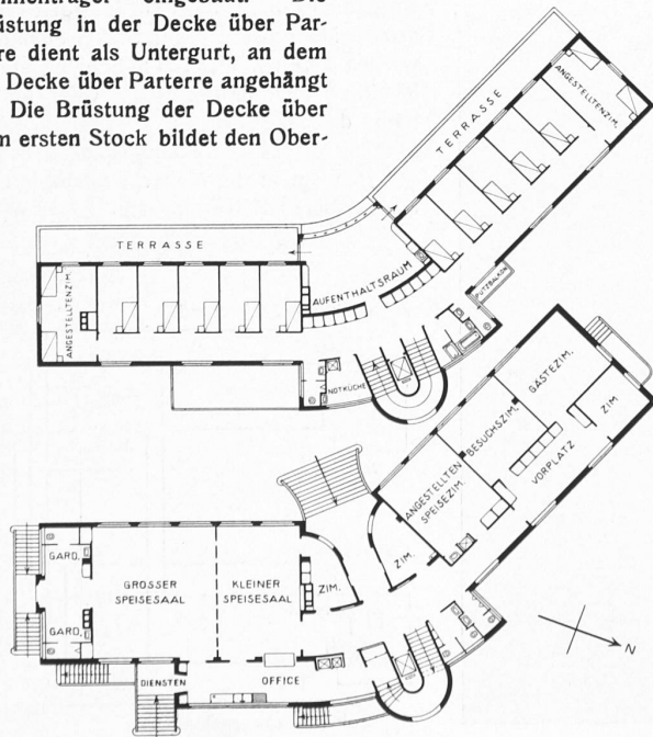
Abb. 1 u. 2. Blinden-Altersheim Horw. — Erdgeschoss und I. Stock, 1 : 500.

Die Geschosse sind gegenüber dem Parterre um rund 1,30 m zurückgesetzt. Im einen Seitentrakt wird die Fassade durch einen Eisenbetonträger, der in der Brüstung der Decke über Parterre eingebaut ist, getragen. Dieser Träger gibt seine Belastung an vier Säulen ab. Im anderen Seitentrakt liegt im Parterre der grosse Speisesaal; Säulen durften nicht angeordnet werden und Träger nicht hervortreten, daher ist in der zurückgesetzten Fassade ein Rahmenträger eingebaut. Die Brüstung in der Decke über Parterre dient als Untergurt, an dem die Decke über Parterre angehängt ist. Die Brüstung der Decke über dem ersten Stock bildet den Ober-