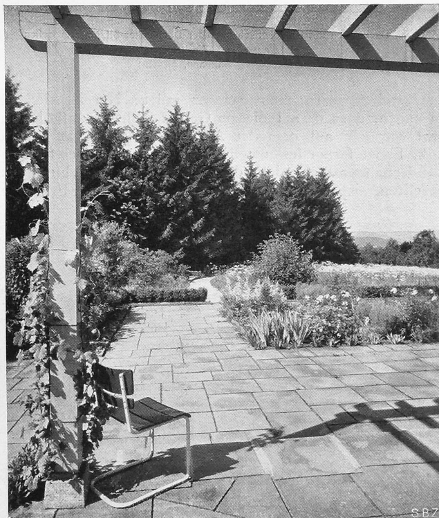
Abb. 2. Landhausgarten bei Basel. Blick vom Sitzplatz am Hause auf Staudenterrasse und Landschaft (J. Schweizer, Glarus-Basel).

[Um die Bildunterschriften nicht zu schwerfällig werden zu lassen, führen wir eingeklammert nur die Namen der Gartengestalter an.]