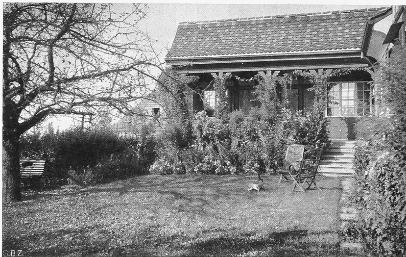
Abb. 1. Sonniger Hauswinkel mit davorliegendem Spielrasen (Gustav Ammann, Zürich).

verschiedener Gartengestalter bekannt zu geben, begleitet von Ausführungsbeispielen schweizerischer Gärten. Es sind Dinge, die ja jeden von uns, so oder so interessieren und deren Ueberlegung beim herannahenden Frühling für manchen auch praktische Anregungen vermitteln möge. Dass am Gartenbau sogar die Maschineningenieure mitwirken können, zeigt der Artikel über neuere schweizerische Bodenbearbeitungs-Kleinmaschinen.