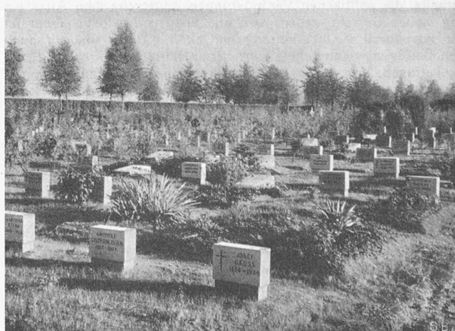
Abb. 8. Neuer Waldfriedhof („Notfriedhof“) bei Stuttgart.