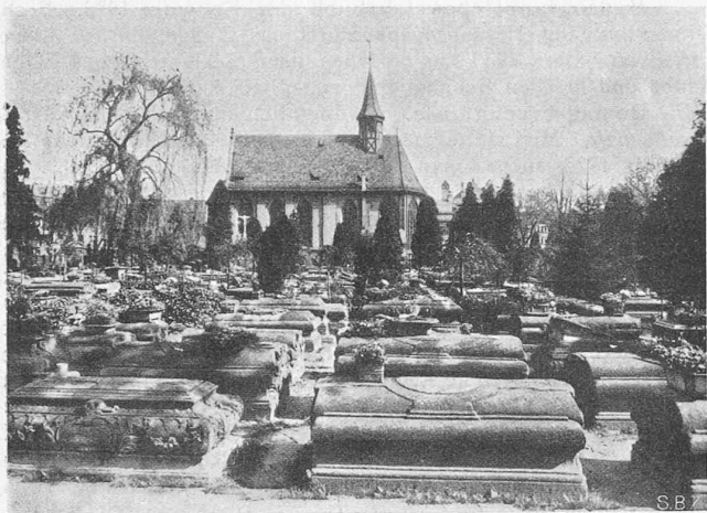
Abb. 3. Alter Johannisfriedhof in Nürnberg, um 1500.