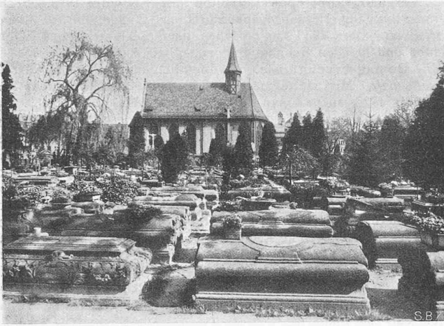
Abb. 3. Alter Johannisfriedhof in Nürnberg, um 1500.