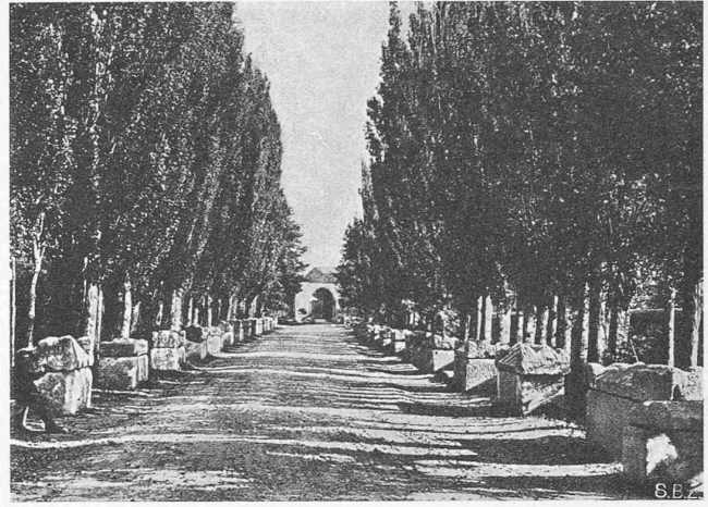
Abb. 4. Gräberstrasse Les Aliscamps bei Arles (Südfrankreich).

Gewiss liegen die Dinge in Wirklichkeit nicht so einfach, wie sie im Programm aussehen, zu viel persönliches Geltungs- und Gestaltungsbedürfnis wird der Verwirklichung dieser Ziele im Wege stehen. Es hat denn auch die Ausstellung lebhaft Diskussion ausgelöst, was ja nur zu begrüßen ist. Abzulehnen, und zwar sehr bestimmt, ist aber jene fadenscheinige Argumentation in Nr. 2057 der „N. Z. Z.“ (13. November 1933), die mit dem abgedroschenen Schlagwort von Auslandsimport und Moskauertum diese Reformbestrebungen verdächtigen wollte. Ob es sich um die Ziegel- oder die Grabstein-Industrie handle, es ist und bleibt ein Unfug, wenn man seine Geschäftsinteressen — auf deren Berechtigung damit nicht eingetreten werden soll — gegenüber einem ahnungslosen Publikum durch gross-tönende, politisch gefärbte Stimmungsmache vertritt und damit die ernsthaften Bemühungen uninteressierter Fachleute zu diskreditieren versucht. Die Richtung, die das Zürcher Kunstgewerbemuseum seit Jahren konsequent verfolgt, ist das Ergebnis gründlicher Durchdringung seiner Aufgabe, und hat mit politischen Dingen nichts, aber auch gar nichts zu tun. Wir danken Direktor Altherr für seine fruchtbare Arbeit und sind überzeugt, dass er auf dem eingeschlagenen Weg weiterschreiten wird zum Nutzen und zur Ausbreitung des Werkbundgedankens.