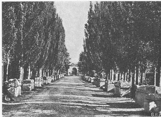
Abb. 4. Gräberstrasse Les Aliscamps bei Arles (Südfrankreich).

Gewiss liegen die Dinge in Wirklichkeit nicht so einfach, wie sie im Programm aussehen, zu viel persönliches Geltungs- und Gestaltungsbedürfnis wird der Verwirklichung dieser Ziele im Wege stehen. Es hat denn auch die Ausstellung lebhaft Diskussion ausgelöst, was ja nur zu begrüßen ist. Abzulehnen, und zwar sehr bestimmt, ist aber jene fadenscheinige Argumentation in Nr. 2057 der „N. Z. Z.“ (13. November 1933), die mit dem abgedroschenen Schlagwort von Auslandimport und Moskauertum diese Reformbestrebungen verdächtigen wollte. Ob es sich um die Ziegel- oder die Grabstein-Industrie handle, es ist und bleibt ein Unfug, wenn man seine Geschäftsinteressen — auf deren Berechtigung damit nicht eingetreten werden soll — gegenüber einem ahnungslosen Publikum durch gross-tönende, politisch gefärbte Stimmungsmache vertritt und damit die ernsthaften Bemühungen uninteressierter Fachleute zu diskreditieren versucht. Die Richtung, die das Zürcher Kunstgewerbemuseum seit Jahren konsequent verfolgt, ist das Ergebnis gründlicher Durchdringung seiner Aufgabe, und hat mit politischen Dingen nichts, aber auch gar nichts zu tun. Wir danken Direktor Altherr für seine fruchtbare Arbeit und sind überzeugt, dass er auf dem eingeschlagenen Weg weiterschreiten wird zum Nutzen und zur Ausbreitung des Werkbundgedankens.