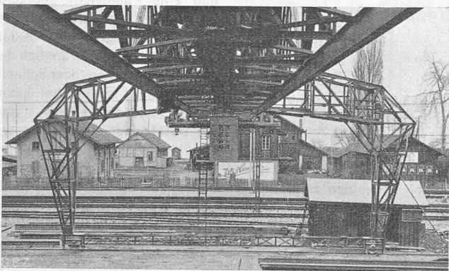
Abb. 3. Bahnseitige „feste“ Stütze, mit Laufkatze.

Der schlechte Baugrund, Auffüllung auf altem Seegebiet, verlangte eine sorgfältige Fundierung für die Laufschiene. In Abständen von je 9,75 m stampfte man je zwei Franki-Pfähle von 6 m Länge. Sie wurden oben durch Querträger verbunden, die als Auflager für den Schienenträger aus Eisenbeton dienen. Dieser erhielt, als durchlaufender Träger von 9,75 m Feldweite berechnet, einen T-Querschnitt mit einer Höhe von 1,05 m. Der Preis stellte sich auf 150 Fr. pro laufenden Meter Fundation, die Locher & Cie. ausgeführt haben.