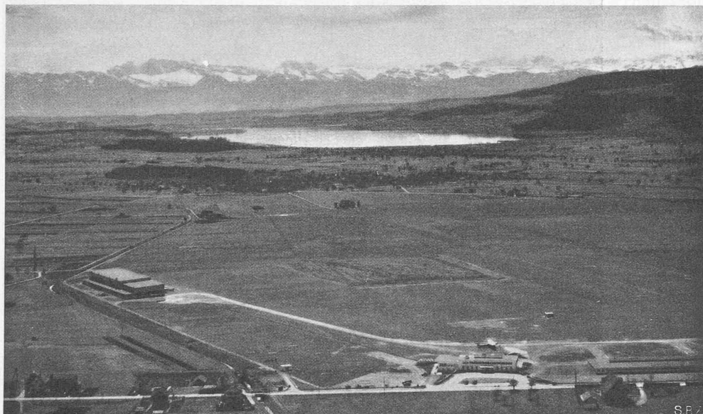
Abb. 1. Fliegerbild des Gesamtgeländes aus N-NW, im Hintergrund der Greifensee.