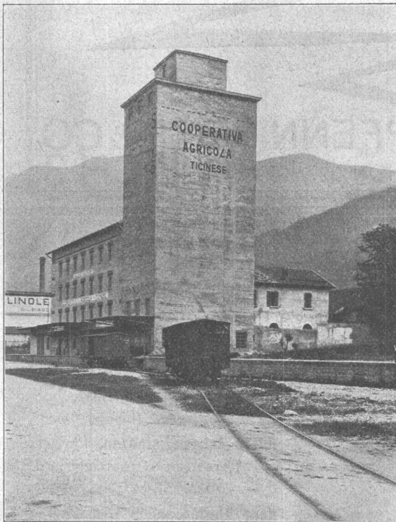
Getreidesilo der Cooperativa Agricola Ticinese in Giubiasco