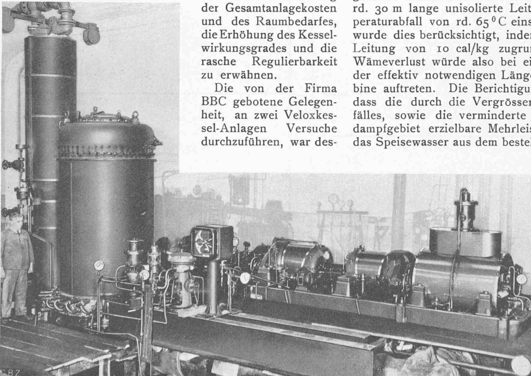
Abb. 1. Veloxkessel-Versuchsanlage in der Fabrik von Brown, Boveri & Cie. in Baden.

Eine weitere Versuchsreihe wurde an einer für eine Zuckerfabrik in Spanien bestimmten Veloxkesselanlage von 32 t/h Dampf allein, also ohne Turbogruppe, durchgeführt (Abb. 3). Bei dieser Anlage konnte ausser der