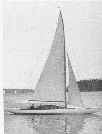
Abb. 3 und 4. Deckaufsicht und „Yg“ in Fahrt am Wind.

führung von vier weiteren Spanten veranlasste. Im übrigen hat sich ergeben, dass die Dimensionen reichlich bemessen waren und eine Reduktion erlauben.