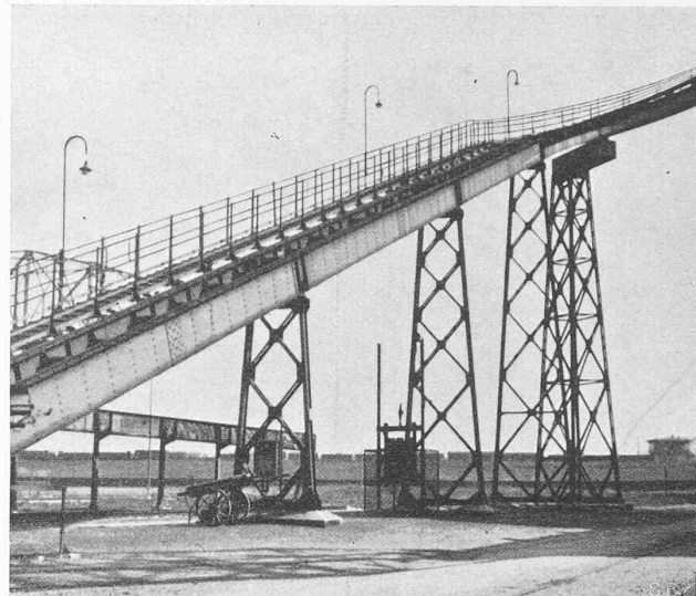
Abb. 11. Ansicht der Koksförderbrücke im Gaswerk Basel von unten.

Wenden wir uns nun noch kurz der zweiten Brücke zu, die dem Kokstransport dient, so ist zu bemerken, dass hier die Verhältnisse etwas schwieriger lagen. Der Höhenunterschied, der bei dieser Brücke überwunden wird, beträgt rund 24,4 m und die Steigung in der Brückenaxe ist rund 1 : 2,5. Die Abb. 11 gibt als Ergänzung der Abb. 2 einen guten Ueberblick über die Anordnung der Brücke. Auch hier haben wir es mit einem Zug von vollwandigen Brückenhauptträgern von konstanter Höhe zu tun. Die Ausnahmen im Stegblech der gekrümmten Träger sind wegen der Anordnung von Seilumlenkrollen erforderlich geworden. Die Pendelstützen haben, um kleine Auflagerreaktionen, bezw. genügende Standsicherheit zu ergeben, einen Anzug erhalten. Besondere Schwierigkeiten machte auch die Anordnung der festen räumlichen Stütze; die Geleise zu ebener Erde erforderten ein starkes Heraussetzen aus der Brückenlängsaxe. An Stelle des oberen räumlichen Stabwerkes, wie wir es bei der ersten Brücke bei der Stütze 3 gesehen haben, wurde hier ein steifes vollwandiges Tragwerk am Kopf der räumlichen Fachwerk-Stütze vorgesehen. Die Vollständigkeit war bedingt aus der Forderung einer besonders grossen Biege- und Torsionsfestigkeit. Die Anordnung der Brücke, ihre Berechnung und die