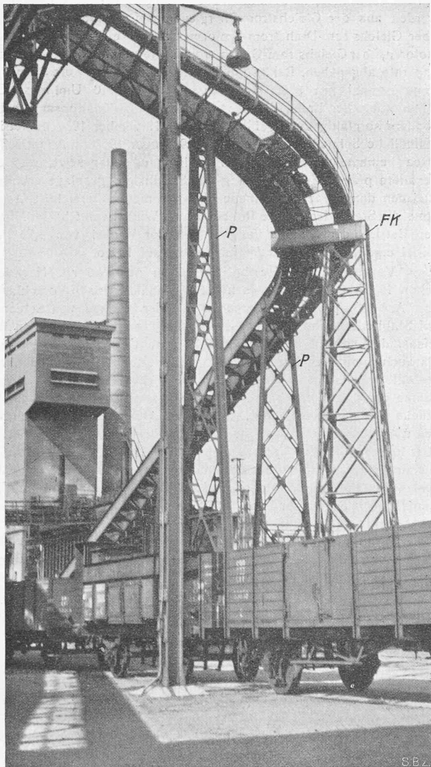
Abb. 12. Blick in den gekrümmten Teil der Koks-Förderbrücke. FK feste Stütze mit Konsolle zur Lagerung der gekrümmten Brücke. P Pendelstützen an den Enden der gekrümmten Brücke.

Luzern 68538 t, Solothurn 57596 t, Baselland 36310 t, Neuenburg 31849 t, Wallis 28641 t, Graubünden 23438 t, Freiburg 22635 t, Schwyz 18596 t, Genf 16789 t, Glarus 14745 t, Zug 10054 t, Schaffhausen 8653 t, Tessin 7881 t, Uri 5891 t, Appenzell A.-Rh. 3541 t, Obwalden 1659 t, Appenzell I.-Rh. 394 t, Nidwalden 269 t, zusammen 1326534 t. Der Rest des Verkehrs entfällt auf das Ausland, d. h. auf Transit und das badische Hochrheinufer.