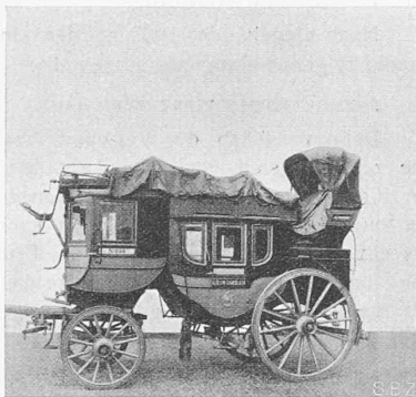
Abb. 1. Gotthardpostwagen bis 1882.

Büsten, Reliefs), Marmor. Cheminées und Platten, keramische Boden- und Wandplatten u. a. — Holz : z. B. Bodenplatten aus Holz, Parkett-Tafeln (quer mit einander verleimt), Ausenverkleidungsplatten aus Holz, glatte Sperrholztüren, Kellertüren, Kipptore, Türrahmen, Rollschutzwände, Holzrolltore, Holzrollladen, Fensterladen, Jalousieladen mit Beschläge, Fenster mit horizontalem Schiebe- und