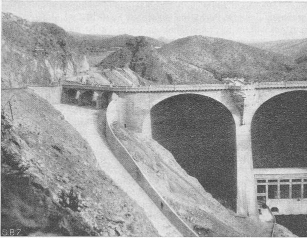
Abb. 1. Rechtsufriger Hochwasserüberlauf der Coolidge-Staumauer (U. S. A.).