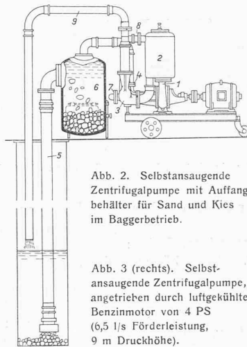
Abb. 2. Selbstansaugende Zentrifugalpumpe mit Auffangbehälter für Sand und Kies im Baggerbetrieb.

Es liessen sich noch manche Beispiele anführen, wie die beschriebenen selbstansaugenden Zentrifugalpumpen als Baggerpumpen gute Dienste zu leisten in der Lage sind. Es mögen aber hier die drei gezeigten Anwendungen genügen, um ein Bild dieser neuartigen hydraulischen Förderung oder Baggerung zu geben. Als