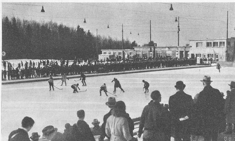
Abb. 1. Blick auf das Eisfeld gegen das Verwaltungsgebäude.