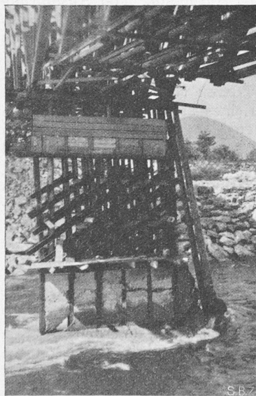
Abb. 1. Die planwidrige Pendelstütze, kurz vor dem Einsturz, den statt der vorgesehenen Ausbetonierung nachträglich aufgeklebte (!) Diagonalen noch hätten aufhalten sollen.

Die Maggia ist einer der wildesten Flüsse der Schweiz. In wenigen Stunden kann ihr Wasserspiegel trotz der sehr grossen Breite des Flussbettes auf den Stand des höchsten Hochwassers steigen.