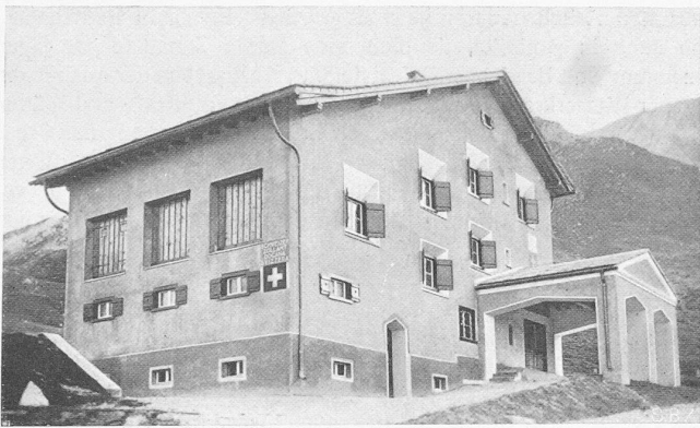
Abb. 2. Zollhaus auf dem Splügenpass, bergwärts gesehen.