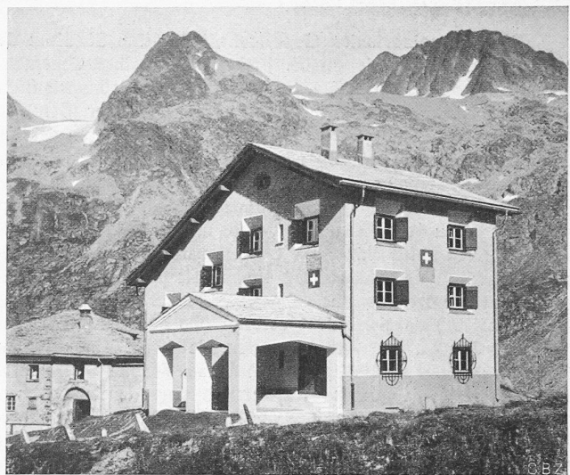
Abb. 3. Schweizer Zollhaus auf dem Splügenpass, erbaut 1929/30 nach Entwurf von Arch. Jak. Nold in Felsberg bei Chur.