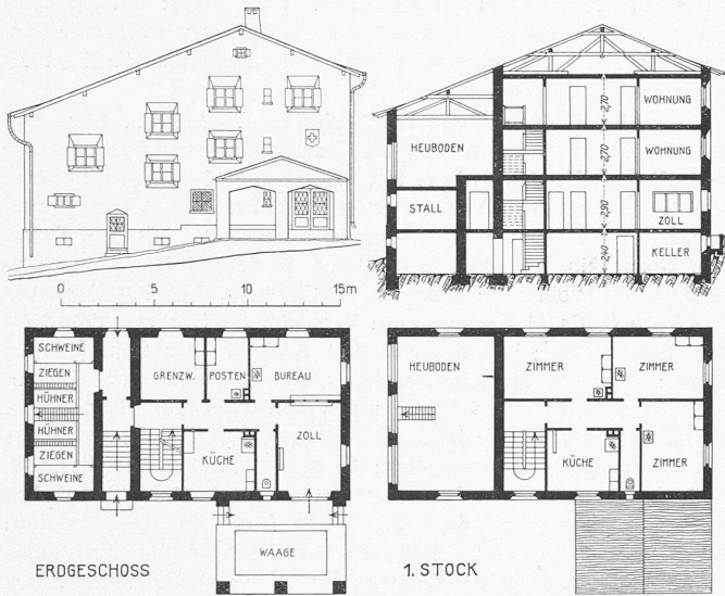
Abb. 1. Grundriss, Schnitt und Strassenfront des Zollhauses Splügen. — 1 : 400.

Netz 30 elektrische Lokomotiven zur Verfügung, davon 80,4% im Fahrdienst. Die höchste Monatsleistung einer Lokomotive belief sich im Jahre 1930 auf 9656 km gegenüber 8869 km im Jahre 1925. Dampflokomotiven sind noch neun in Betrieb, seit 1928 dazu noch eine Benzinmotorlokomotive.