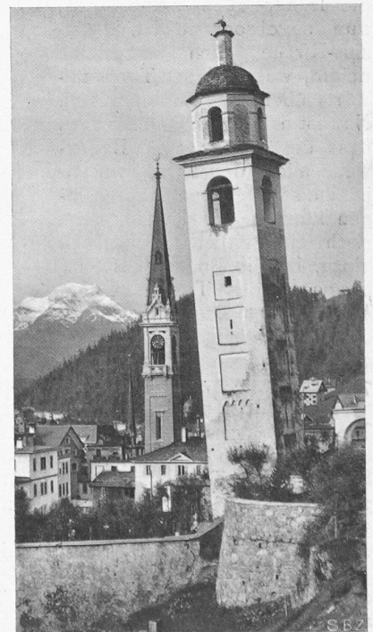
Abb. 2. Alter und neuer Turm aus Nordosten.

Es ergibt sich schon aus früheren Beobachtungen, dass der Turm auf unruhigem Grunde steht. Seitherige Messungen von Punkten der Umgebung zeigten auch mehr oder weniger grosse Senkungen sowie Bewegungen talwärts. Der Boden besteht nämlich aus einem alten Berg-rutsch, der sich am Felskamm, auf dem das Hotel Kulm steht, aufgestaut hat. Der Druck in diesem Schuttmaterial ist bedeutend und äussert sich in Wulstbildungen, indem weiches Material von härterem emporgequetscht wird. Durch die auf ein Gutachten von Prof. Alb. Heim hin vorgenommenen Entwässerungen im obern Rutschgebiet ist die Gefahr grösserer Bewegungen nach menschlichem Ermessen behoben worden, und es dürfte auch mit der Zeit eine weitere Beruhigung des Geländes sich einstellen.