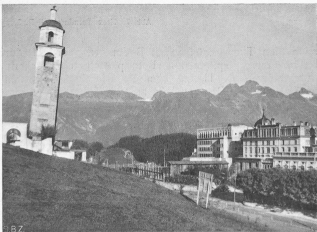
Abb. 3. Der alte Turm aus Westen, rechts Hotel Kulm.

[Der Leserkreis der S. B. Z. wird es dem Herausgeber, dem Enkel eines Bündner Bergpfarrers, zugute halten, wenn er im vorliegenden Heft, zu Ehren der heute in St. Moritz tagenden G. E. P., zwei alte Bündner Kirchtürme vorführt, die zwar gegen die bautechnischen Schulregeln arg verstossen, dessenungeachtet aber ein recht ansehnliches Alter erreicht haben. Zudem können sie, trotz ihrer Krümme, neben manchem kunst- und stilvollen (sogar übervollen, Abb. 2!) neuern Bau noch recht wohl bestehen, weshalb wir finden, es lohne sich, sie, wie in Natura, so hier auch im Bilde festzuhalten. Auch der Vergleich des Dorfbildes von St. Moritz einst und heute mag interessant erscheinen, wobei wir uns aber (schon des Raumes wegen!) auf diesen objektiven Hinweis beschränken wollen. Höchstens die Bemerkung sei noch gestattet, dass in dem heutigen Schlagwort von der „Neuen Sachlichkeit“ die Sachlichkeit an sich — laut obigem Bilde — offenbar keine neue Erfindung ist. C. J.]