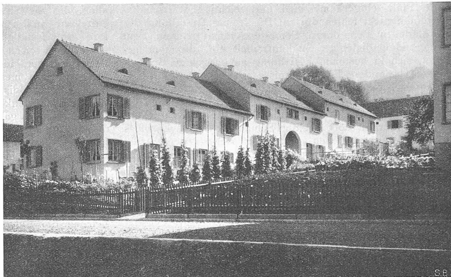
Abb. 2. Wohnkolonie der Heimgenossenschaft Schweighof am Friesenberg in Zürich.

Der Schweiz. Schulrat, die Eidgen. Techn. Hochschule, ihre Professoren, Dozenten und Assistenten, sie leben Hoch!