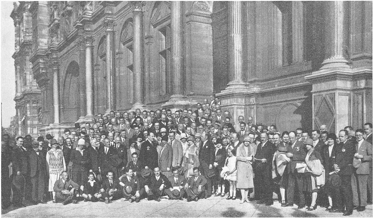
Gruppenbild von Teilnehmern an der Generalversammlung der G. E. P. vor dem Hotel de Ville in Paris, am 28. September 1929.