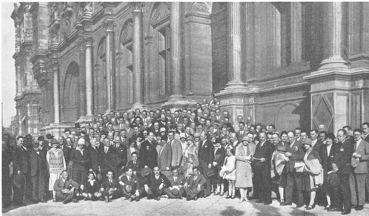
Gruppenbild von Teilnehmern an der Generalversammlung der G. E. P. vor dem Hotel de Ville in Paris, am 28. September 1929.