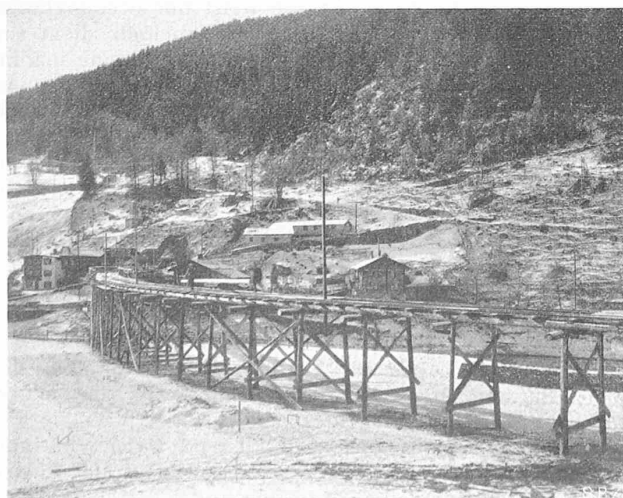
Abb. 3. Dienstbrücke zum Portal des Kehrtunnels.

Ausfahrt in Landquart und der Einfahrt in Davos-Platz sind noch in frischer Erinnerung.