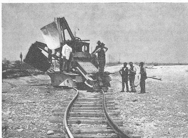
Abb. 16. Obige Maschine als Geleiserückmaschine arbeitend.

Lugano ergaben in der Luft sofort nach dem Einschlag Feldstärken zwischen 10 und 100 kV und Feldstärkenänderungen von 100 kV/m innerhalb \frac{1}{10} sec. Die Blitzstromstärken wurden in der Grössenordnung von 50 000 A gemessen. Bei derartigen Blitzschlägen in die Freileitung sind Ueberschläge der Isolatoren kaum zu vermeiden. Die starke Dämpfung der hohen Blitzspannung längs der Leitung macht aber entferntere Blitzschläge für die Stationen ziemlich ungefährlich, und es kann ausserdem ihre Wirkung durch die Vorlagerung einer Leitungstrecke mit verminderter Isolation noch weiter herabgesetzt werden. In der nachfolgenden Diskussion gingen die Meinungen über die Zweckmässigkeit dieser Anordnung noch auseinander. Schirmringe an den Leitungsisolatoren zur Erzielung einer gleichmässigen Spannungsverteilung und damit zum Schutz gegen Erdschluss-Lichtbogen haben sich allgemein durchgesetzt.