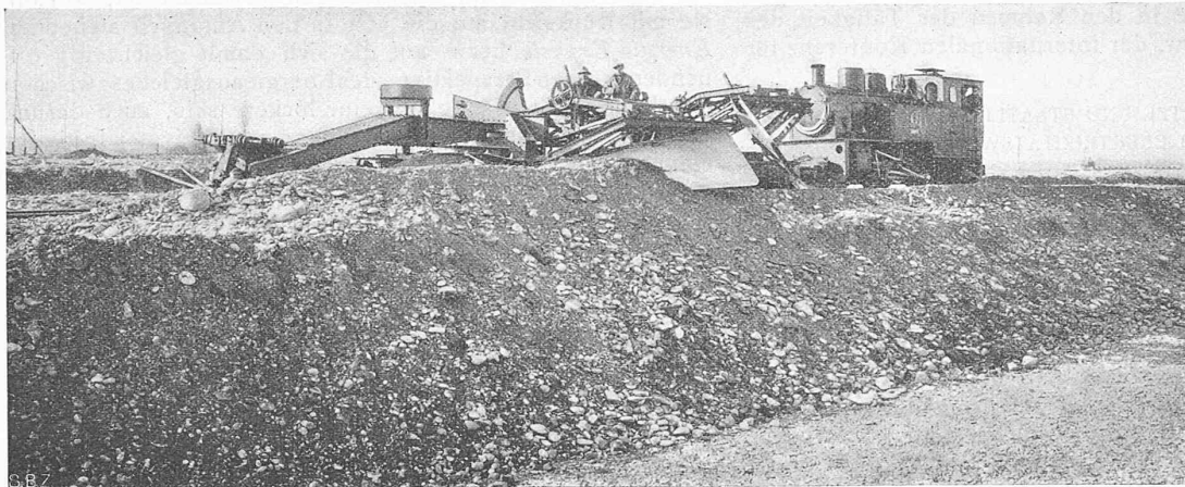
Abb. 15. Pflug- und Geleiserückmaschine der Lauchhammerwerke A.-G., als Pflug arbeitend.