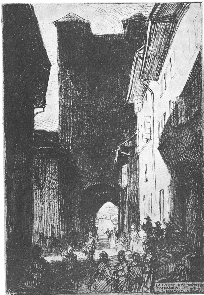
LA PORTE DE BERNE A FRIBOURG VUE DU COTÉ VILLE D'APRÈS GRAVURE PAR AUG. GENOUD, ARCHITECTE