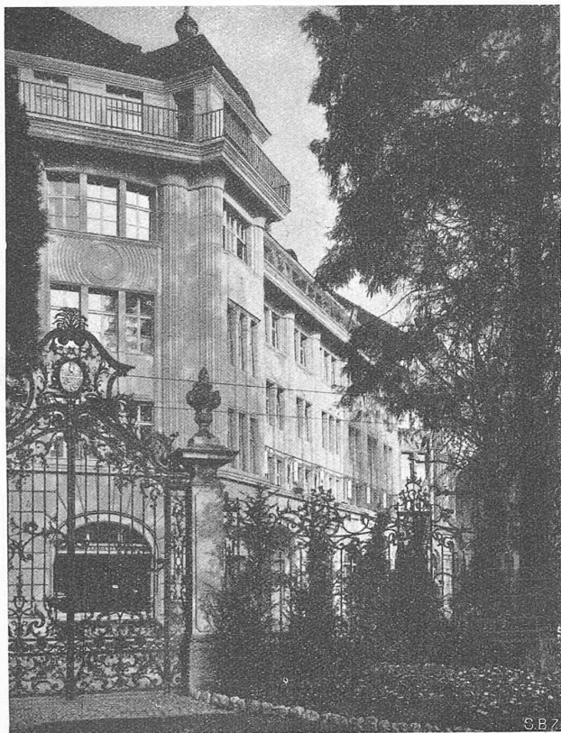
Abb. 1. Die Neubau-Ecke am Talacker.