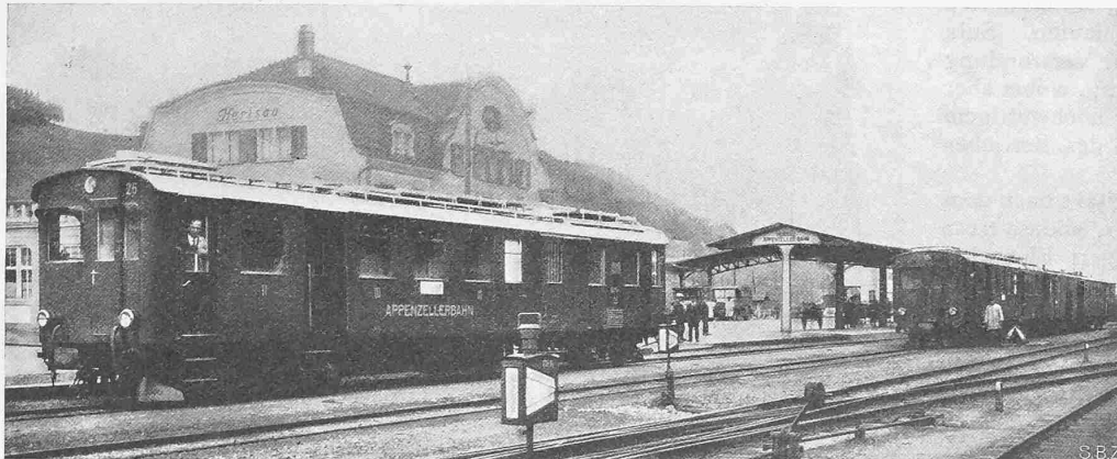
Abb. 1. Zwei Sulzer-Dieselmotor-Triebwagen in der Station Herisau.