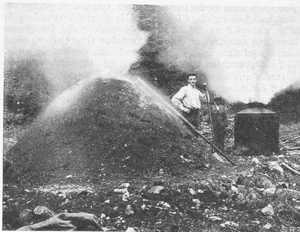
Abb. 4. Vergleichsversuche mit Meiler und tragbarem Ofen.

sind grundsätzlich unabhängig vom Widerstand der Leitung, sie können ohne weiteres auch drahtlos oder mit leitungsgerichteter Hochfrequenz übertragen werden. Jedes dieser Verfahren ist bereits so weit in der Praxis erprobt, dass Einrichtungen zur Fernmessung über grössere Strecken schon auf längere Betriebszeiten, bis zu etwa einem Jahr, zurückblicken können.