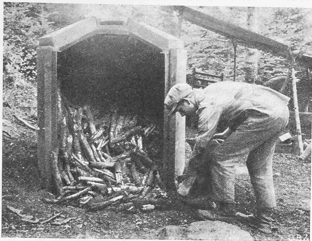
Abb. 3. Entleerung des Ofens nach der Verkohlung.