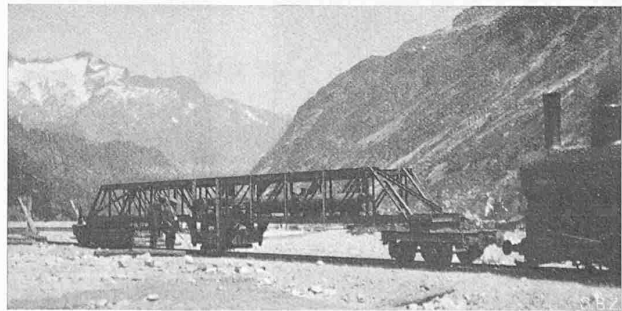
Abb. 3. Baggerelcise-Rückmaschine Arbenz-Kammerer.