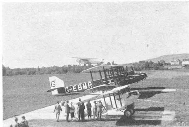
Abb. 2. Einsteige-Perron vor dem Aufnahme-Gebäude.

sich in der Regel mit 600 bis 1000 m begnügen. An diese Rollzone schliesst sich, mindestens wenn sie auf 600 m beschränkt werden musste, eine Schutzzone an, die Ackerland sein kann, aber keine Hindernisse mit Höhenausdehnung besitzen darf; sie dient dem Flugzeug zum Beschleunigen von der Minimalgeschwindigkeit des Abfluges auf die, ein Steigen erlaubende Normalgeschwindigkeit. An die Schutzzone schliesst sich dann die Steigzone an, in der kein Hindernis über eine Ebene vom Winkel 1:40 hinausragen darf.