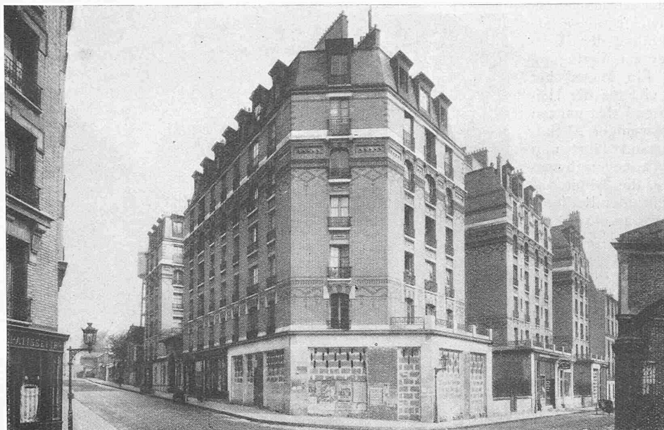
Abb. 2. Pariser Wohnungs-Fürsorge; Rue du Télégraphe (Ménilmontant).

lfd. Bds.) wird Gelegenheit bieten, die Architektur dieser umfangreichen Neubauten noch näher zu studieren. Vergleichsweise sei erinnert an die Wiener Gemeinde-Wohnbauten auf dem „Fuchsenfeld“ in der „S. B. Z.“ Band 84, Seite 19 (12. Juli 1924). Ob die an den „Bauwisch“ (z. B. in den älteren Vorstadtquartieren Stuttgarts) erinnernden kluftartigen Einschnitte in den Baublöcken (z. B. Abb. 1) auf öffentlich-rechtlichen Bauvorschriften beruhen, geht aus den Ausführungen unserer Quelle nicht hervor.