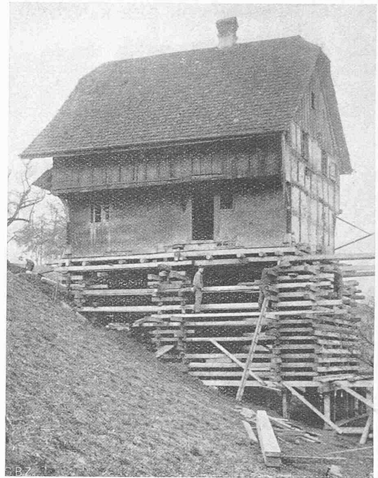
Abb. 2. Hebung auf einer 10 m hohen Böschung.

Art. 13. Die Bestimmungen des vorliegenden Uebereinkommens bleiben auch in Kriegszeiten in Kraft.