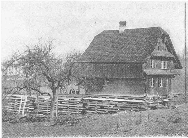
Abb. 1. Verschiebung Hof Staffeln am Reussbühl (Luzern).

in diesem Uebereinkommen genannten Verleihungen betreffen, nicht sollten einigen können, so ist der Streitfall, sofern er nicht innert angemessener Frist auf diplomatischem Wege erledigt werden konnte, durch einen im Einvernehmen der beiden Regierungen zu bezeichnenden Schiedsrichter zu entscheiden.] Während der Bauzeit hat diese Kommission die Ausführung der Bauarbeiten am Kraftwerk Kembs zu überwachen und ihre Wahrnehmungen in Form von Berichten den zuständigen französischen und schweizerischen Behörden zu unterbreiten. Während der Betriebsperiode ist die Kommission zuständig für die Prüfung und Lösung sämtlicher Fragen, die gleichzeitig für die Handhabung der französischen und der schweizerischen Verleihung von Interesse sind. Sie wacht über die Ausführung ihrer Beschlüsse. Die beiden Regierungen verpflichten sich, innerhalb ihrer Staatsgebiete die von der Kommission gegenüber dem Konzessionär im Rahmen der Verleihungen gefassten Beschlüsse zur Durchführung zu bringen.