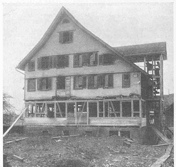
Abb. 5. „Mennerhaus“ in Baar, verschoben, gedreht und gehoben.

Es dürfte die Leser unseres Blattes interessieren, anhand einiger Beispiele zu sehen, welche achtbare Leistungen Näf auf diesem Gebiet der Zimmermannskunst aufzuweisen hat. Wir haben die hier vorgeführten Objekte aus etwa 30 durchgeführten ähnlichen Arbeiten als Beispiele ausgewählt; die Bilder verdanken wir zum Teil Phot. A. Krenn (Zürich), zum Teil Herrn Näf, der uns auch die nachfolgenden textlichen Erläuterungen dazu gibt. Wie sicher er des Erfolges seiner sorgfältigen Arbeit ist, lassen die eingehängten und unbeschädigt gebliebenen Fenster erkennen; sogar die Bewohner können ungefährdet die Reise mitmachen, wie z. B. im Dreifamilienhaus der Papierfabrik Perlen, das auf Seite 104/105 gezeigt wird.