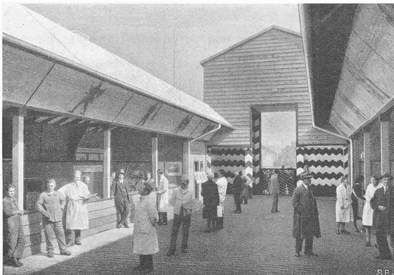
Abb. 3. Im Innern der „Gewerbe-Gasse“.

aussen kupferrot. Hoffläche Rasen, Hauptzugang zur Repräsentationshalle eingefasst mit roten Salvia-Beeten.