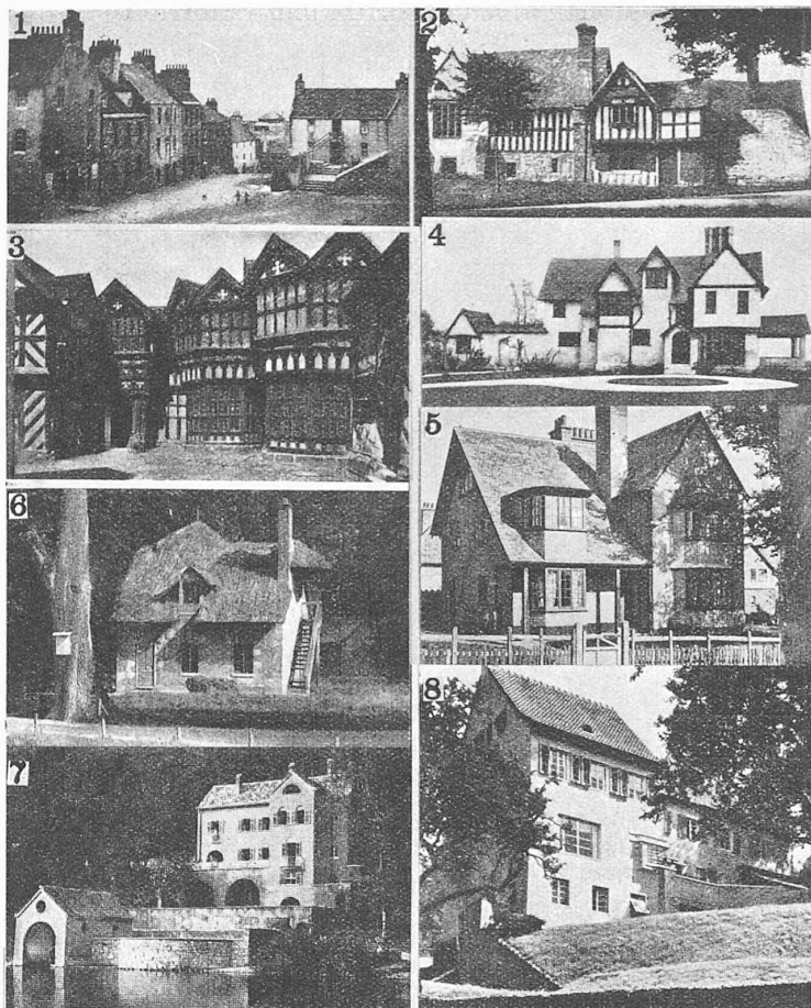
TAFEL IV: ROMANTIK. 1 und 2 Ausgangsformen der romantischen Formenreihe; mittelalterliche Bauten der vorklassischen Zeit, wie sie als Architektur des Bürgertums, und in England — eine Folge seiner kulturellen Isolierung — auch in den Kreisen des Adels bis zur Gegenwart weiter gebaut wurden: 1. Strasse in England, Reihung der Einzelbauten ohne starre Symmetrie und Unterordnung unter eine Dominante; typisch mittelalterliche Komposition, wie sie auch auf dem Kontinent bis ins XVII. Jahrhundert allgemein üblich war. — 2. Altenglischer Herrensitz, „manoir“ gotischer Bauart. — 3. Little Moreton-Hall; Reichere Anlage als 2, erbaut 1559; als Beleg für das Weiterleben der rein gotischen Tradition in der Epoche der Renaissance. — 4. Modernes englisches Landhaus. Ein unmittelbarer Nachkomme von 2, wobei unentschieden bleibt, wie weit es sich um Romantik, d. h. bewusste Umkehr ins Historische, oder um direktes Weiterleben der Tradition handelt. — 5. Haus der modernen Gartenstadt Bourneville. Durch Vereinfachung aus dem Typus 4 abgeleitet: Bindeglied zwischen den handwerklich hergestellten, ausgesprochen individualistischen und oft sentimental Bauten von Typus 4 und maschinell erzeugter, typisierter Architektur. An Bauten dieser Art ist das private Wohnen zuerst nach modern-technischen Gesichtspunkten durchorganisiert worden, von ihnen ging auch der Impuls zur Auflösung des klassischen Kubus aus. — 6. Häuschen der Meierei im Park des Trianon, Versailles. Typische Romantik (in englischer Färbung). Bewusste Umkehr und Flucht der mit monumentalem Pathos übersättigten französischen Hofgesellschaft ins Primitive und Altertümliche. Die Seelenhaltung, die sich darin ausspricht, wirkt noch heute nach, sie ermöglichte das Eindringen des englischen Wohnungstypus 4 und 5 auf dem Kontinent, wo die spezifische englische Note bald gegen Anklänge an die eigene Vergangenheit ausgetauscht wurde. — 7 zeigt italienische, 8 schweizerisch-ländliche Nuancierung der romantischen Grundidee. Die besten Wohnbauten seit der Jahrhundertwende gehören in diese Gruppe, Muthesius zum Beispiel. 7 und 8 zeigen, wie die Entwicklungslinie ohne Bruch in die moderne Architektur mündet.

Grundrisse; Romantik; Historizismus; Monumentalgebäude; Sakrale Fabriken; Funktionalistischer Symbolismus; Sakrale Faustik, Nordik, Wien; Funktionelle Form; Pseudo-moderne Bauten; Moderne Massenwohnungen; Moderne Architektur und Moderne Innenräume. Jede Tafel ist von knappen Erläuterungen begleitet, wie hier begedruckt.