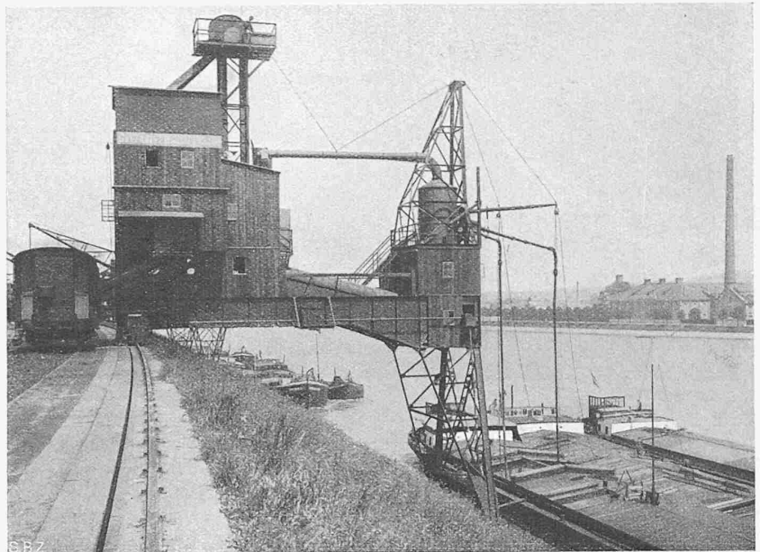
Abb. 27. Fahrbarer pneumatischer Getreideheber im Rheinhafen Basel-St. Johann.

Die mittlere Förderhöhe zwischen Wasserspiegel und Bahnwagenboden beträgt rund 15 m, der Leistungsverbrauch pro gehobene Tonne rund 1,0 kWh. Der Heber ist imstande, stündlich 80 t Getreide zu fördern.