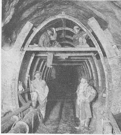
Einrüstung mit eisernen Lehrbögen in der Molassestrecke des Sulgenbachstollens.

Aufgabe die Ableitung sämtlicher Schmutz- und Meteorwasser des gesamten Südwestquartiers der Stadt Bern ist. In diesem Einzugsgebiet sind Bümpliz zu \frac{4}{5} und die Gemeinde Köniz ganz inbegriffen. Die Durchleitung der Abwasser in einem Stollen unter der Stadt hindurch ist deshalb erforderlich, weil die unhaltbare und stets zunehmende Verunreinigung der kleinen und grossen Aare im Marzili, in die die Kanäle bis heute eingeleitet werden, und wo zur Sommerzeit ein sehr reger Badebetrieb herrscht, ausgeschaltet werden muss. Dazu kommt, dass sich das bestehende Kanalnetz im untern Teil des Südwestquartiers schon bei Mittelwasserständen der Aare im Rückstau befindet. Durch die Verlegung der Ausmündung des Kanals auf die Nordseite der Stadt wird ein Höhenunterschied der Kanalausläufe in die Vorflut von 4 m gewonnen. Die dadurch erreichte tiefe Lage des Kanals im Marzili gestattet nebenbei die richtige Entwässerung des Marziliquartiers und des Marzilimooses, wodurch ein in nächster Nähe des Stadtzentrums liegendes Gebiet im Wertesteigt und der Ueberbauung erschlossen wird.