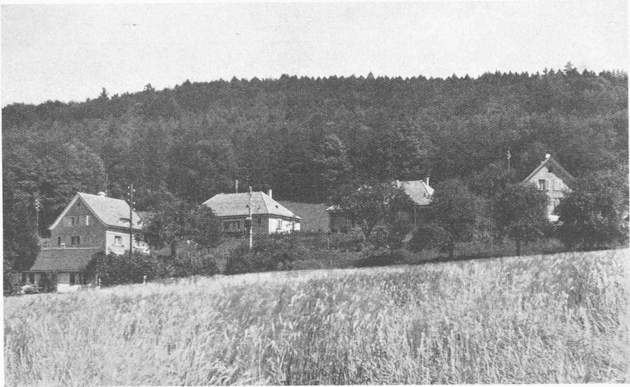
Abb. 1. Gesamtbild aus Westen, im Hintergrund der Zürichbergwald.

Turbinen-Ein- und Ausläufe, bei denen die gute Wasserführung von Fall zu Fall studiert werden muss; Schiffahrtskanäle, die, mit Kraftkanälen kombiniert, in bezug auf Wirtschaftlichkeit der Kraftausnutzung und Sicherheit der Schifffahrt zu befriedigen haben; Schleusen und deren Füll- und Entleerungs-Organen; Sperren und Abflussgerinne von Wildbächen.