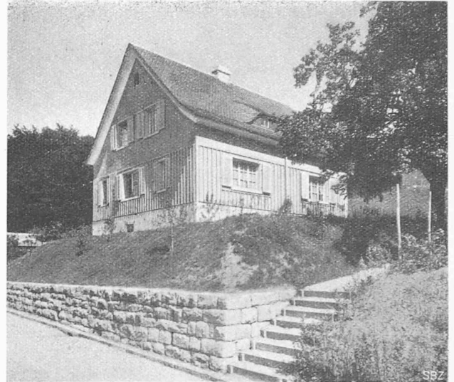
Abb. 4. Haus IV von Westen.

Aufgaben herangestellt, die eine stark entwickelte Beobachtungsgabe verlangen.