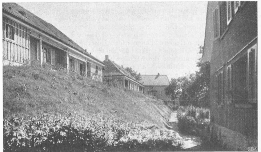
Abb. 5. Links Häuser III und II aus Nordost; rechts die Rückseite von Haus IV.

fast ausschliesslich Etagenwohnungen; es wurden auch Bauten mit fünf bis sechs Wohngeschossen erstellt. Die schon vor dem Krieg begonnene Entwicklung, das als ideal bezeichnete Klein-Einfamilienhaus zu fördern, trat wegen der starken Baukostenverteuerung immer mehr in den Hintergrund. Dieser Entwicklung der Dinge wollte der Verband nicht untätig zusehen, in der Erkenntnis, dass das Einfamilienhaus doch das Fundament aller Wohnkultur und im