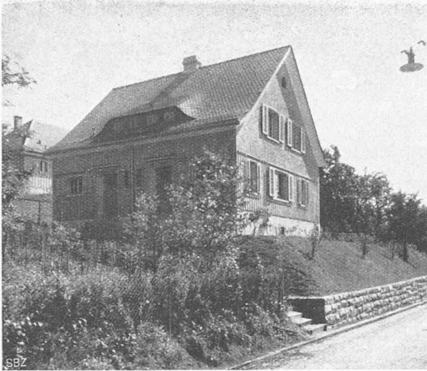
Abb. 3. Haus IV von Norden.