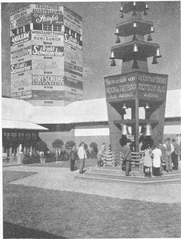
Abb. 2. Reklameturm und Glockenspiel.