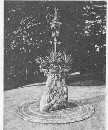
Park-Kandelaber mit Blumensockel in Hamburg. Aus J. Stübßen: „Der Städtebau“. (Stark verkleinert.)

Ausfuhr elektrischer Energie. Das Eidgen. Departement des Innern hat laut „Bundesblatt“ vom 25. März den Officine Elettriche Ticinesi S. A. in Bodio-Baden die vorübergehende Bewilligung erteilt, über den Rahmen der bestehenden Bewilligungen 50, 69 und V 3 1) , aus ihrem Kraftwerk Tremorgio weitere 2000 kW, bzw. täglich max 48000 kWh an die Soc. Lombarda per distribuzione di energia elettrica in Mailand auszuführen. An die Bewilligung wurde u. a. die Bedingung geknüpft, dass dafür die von den Kraftwerken Brusio an die Soc. Lombarda und weiter die von den Rhätischen Werken in Thusis an die Kraftwerke Brusio bisher gelieferte Energie um mindestens 25000 kWh herabgesetzt werde. Durch diese Massnahme soll den Rhätischen Werken ermöglicht werden, täglich mindestens 25000 kWh in das Netz des Elektrizitätswerkes der Stadt Zürich und der Nordostschweizerischen Kraftwerke überzuführen und daselbst die Energieknappheit zu mildern. — Damit ist also, entgegen den seinerzeitigen Ausführungen des Amts für Wasserwirtschaft 1) , doch eine Möglichkeit gefunden worden, um, wenn auch auf indirektem Wege,