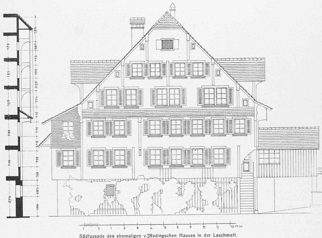
Südfassade des ehemaligen v. Redingschen Hauses in der Läschmatt.

JS: DAS BÜRGERHAUS IN DER SCHWEIZ — IV. BAND: KANTON SCHWYZ. — II. AUFLAGE. Herausgegeben vom Schweizerischen Ingenieur- und Architekten-Verein. — Verlag des Art. Institut Orell Füssli, Zürich.