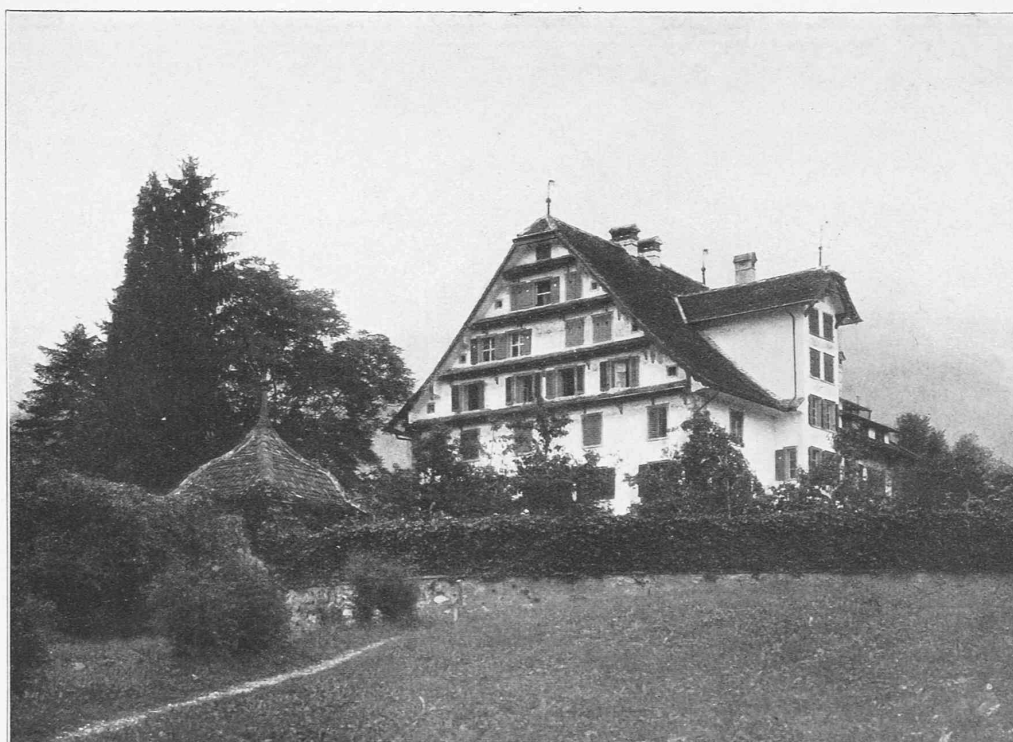
Oben: Ansicht von Norden