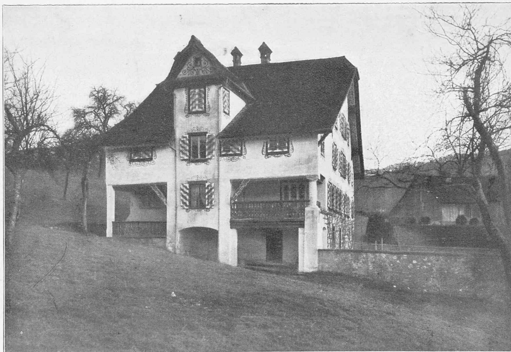
EHEMAL. GASSERSCHES HAUS „ZUR GARTENLAUBE“, OBERE SAGENMATT (1570)