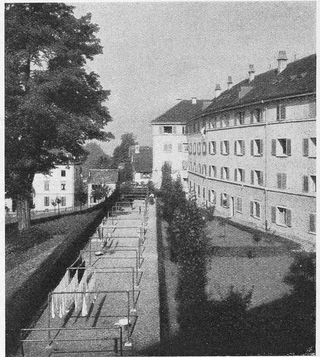
Abb. 14. Rückseite der Häuser I bis VI an der Imfeldstrasse, aus Südost.