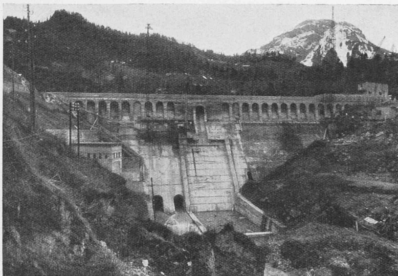
Abb. 18. Stauwand im Rempen des Kraftwerks Wäggitäl, Luftseite (15. April 1924).