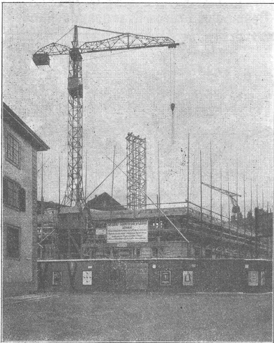
Neubau Schweiz. Volksbank Zürich Architekten: Honegger & Moser, Zürich

Erstellung schlüsselfertiger Ein- familienhäuser in kürzesten Fristen