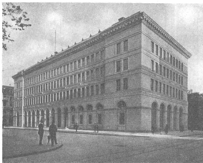
„Schweizerische Nationalbank in Zürich“.