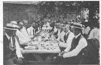
Abb. 8. Tafelfreuden.

Nur zu früh wurde es Zeit zur Heimfahrt. Es ist aber immer gut, ein Vergnügen auf dem Höhepunkt, oder doch möglichst bald nachher abzubringen. So wars auch hier, und die Teilnehmer, die auf gegen 500 angewachsen waren, hegen sicher heute noch die beste Erinnerung an den in