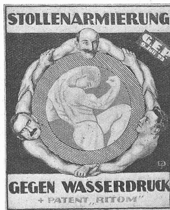
Abb. 6. Eidgen. Stollen-Triumvirat.