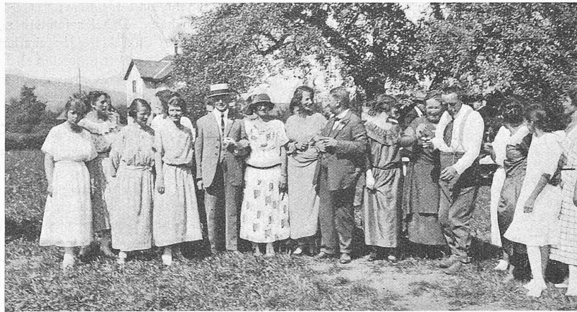
Abb. 9. Der Ex-Präsident der G. E. P. im Kreise der Damen auf dem Festplatz in Siebnen.

Ehemaligen rücksichtsvoll angepasst, gleichzeitig die einzelnen Baumschatten ausnützend. So gab es lauter kleinere Gruppen und bei jeder keinen zu grossen Lärm, der zunächst vorwiegend aus Teller-, Löffel- und Gläser-Geräuschen zu harmonischer Einheit verschmolz. Unsere Bildchen, die wir verschiedenen Kollegen verdanken (einige weitere wird das nächste G. E. P.-Bulletin bringen), geben Einzelheiten aus jenem höchst vergnüglichen Lagerleben wieder, das durch die sympathische weibliche Bedienung noch besondern Reiz gewann. Ja: besonders! Denn der Berichterstatter war stiller (im Gegensatz zu „aktiver“) Teilnehmer einer artigen Szene, die sich vermutlich auch an andern Tischen abgespielt haben wird. Ein etwas, sagen wir lyrisch veranlagter Kollege wollte durch sanftes Streicheln der ihn bedienenden Hebe offenbar seine Dankbarkeit bezeugen, wunderte sich aber, keine Gegenliebe zu finden, bis ihm sein Nachbar mit freundschaftlichem Rippenstoss bedeutete: das sind doch