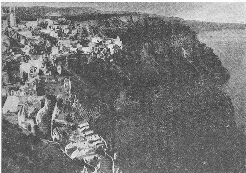
Abb. 1. Die Stadt Phera am Südufer (ehemal. Kraterstrand) der Insel Santorin (Thera).