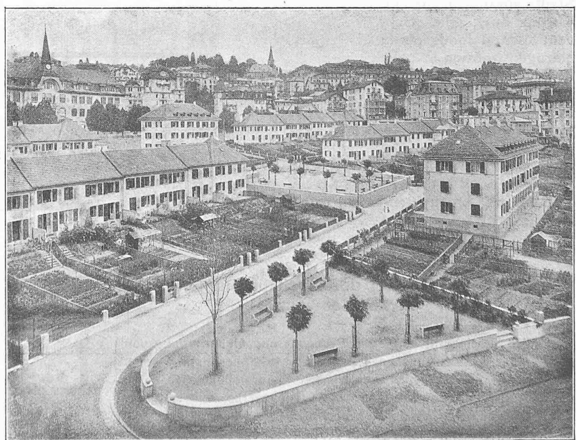
Abb. 3. Genossenschafts-Wohnbauten in Prélaz bei Lausanne (aus Süd-West).

Gestützt auf eingehendes Studium englischer, deutscher und schweizerischer Beispiele sind die Architekten zu dem